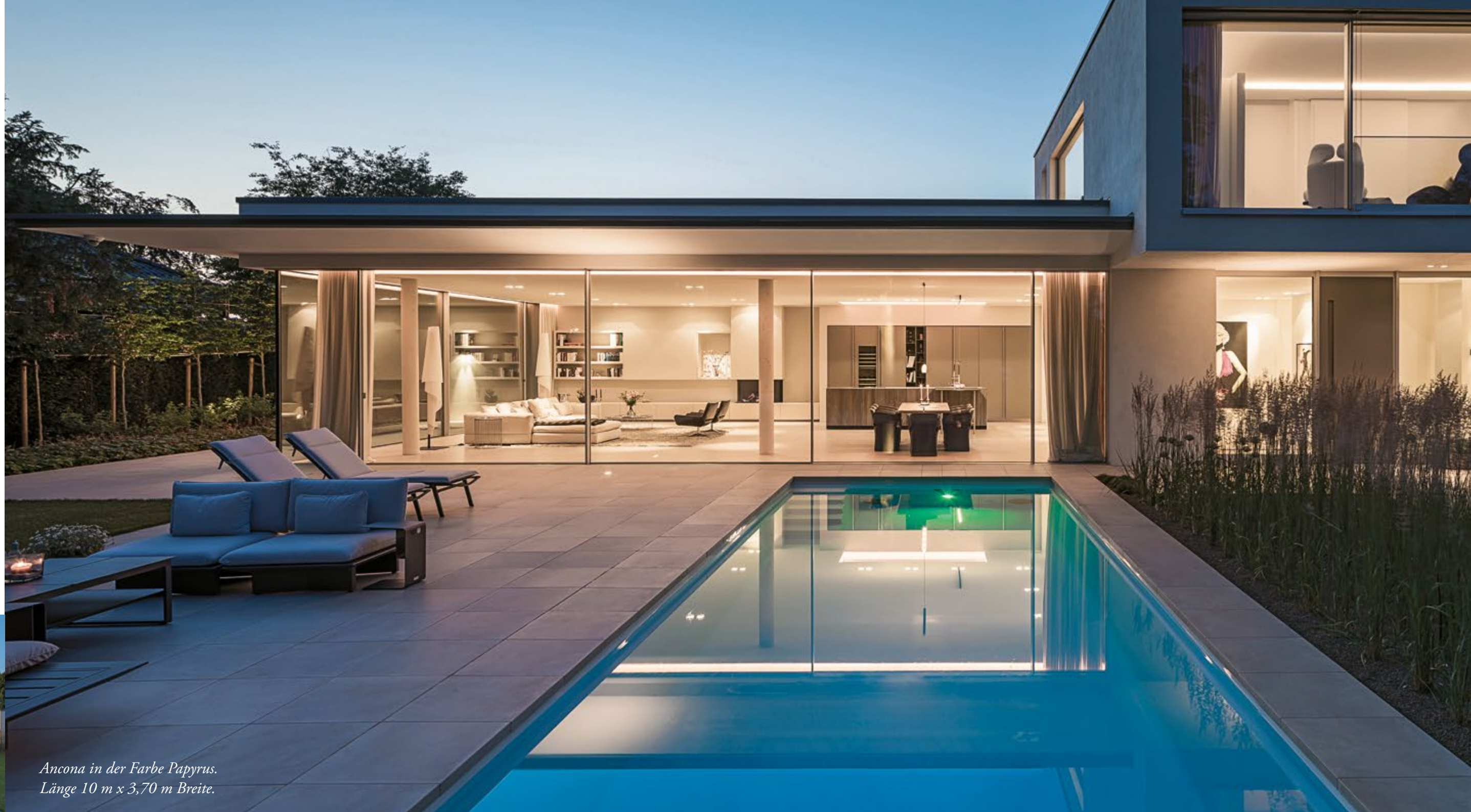
Ancona in der Farbe Papyrus. Länge 10 m x 3,70 m Breite.