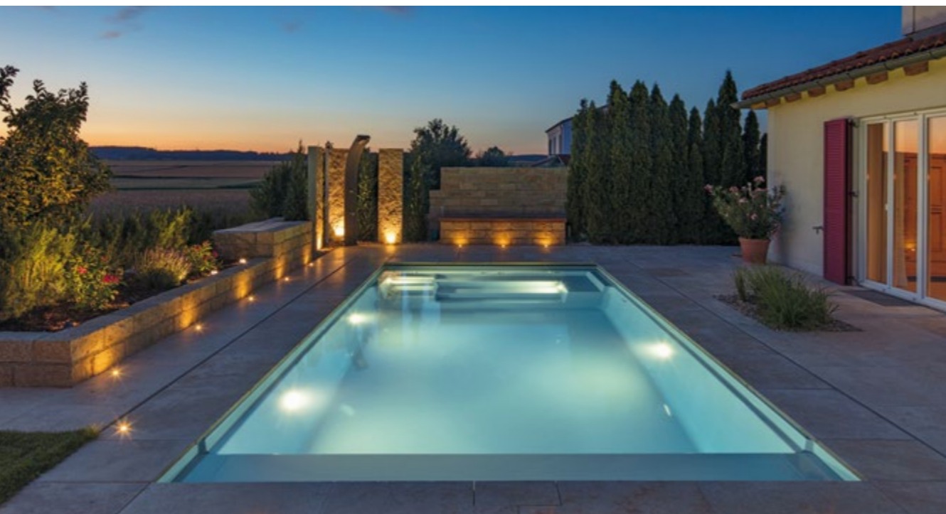
Das Modena 370: Zeitgemäßes Pooldesign für Ihr Zuhause. Ihre Familie wird es lieben: Chillige Sitz- und Liegeflächen. Dieses Becken ist 7,75 m x 3,70 m. Farbe in Granicite Steingrau.