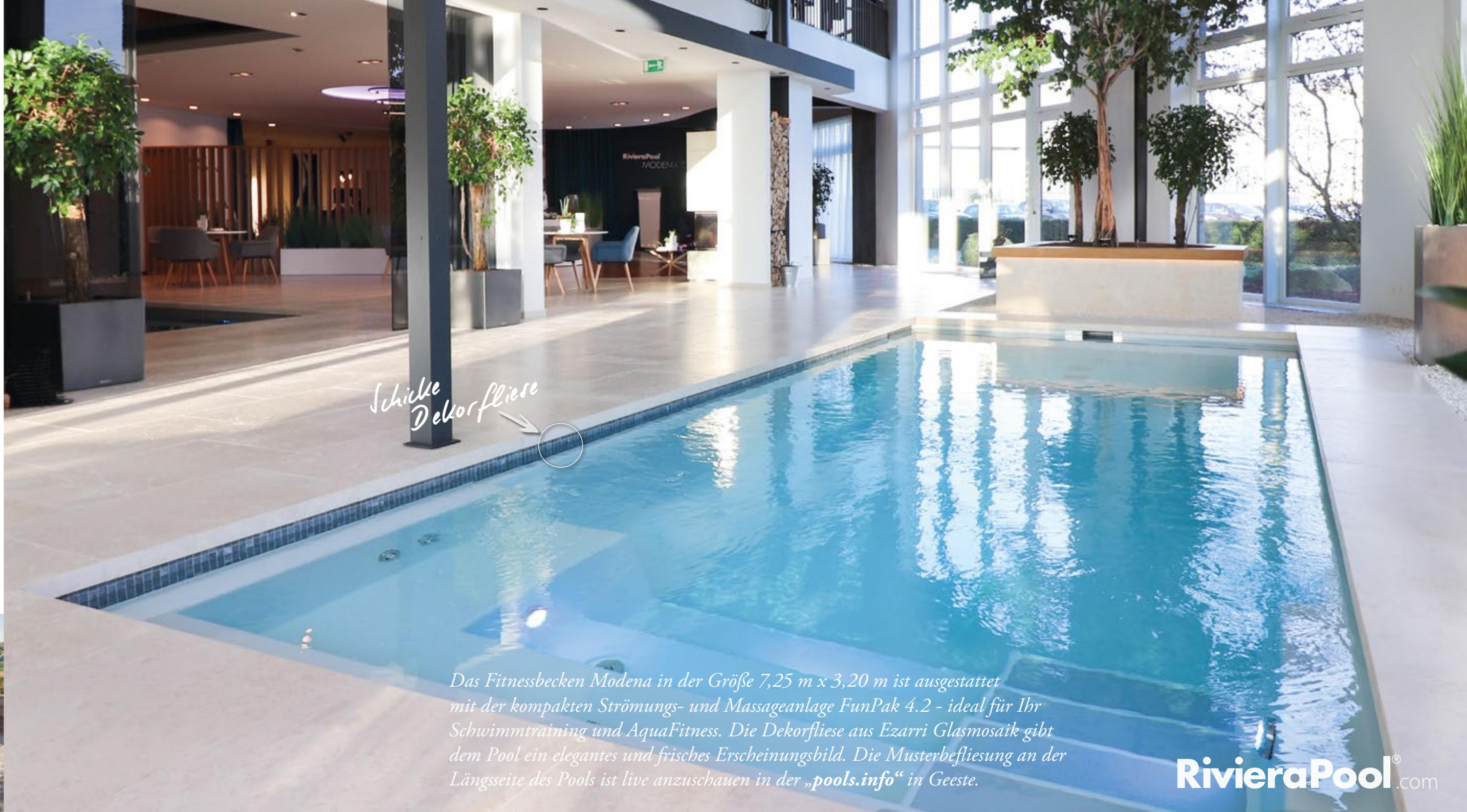
Das Fitnessbecken Modena in der Größe 7,25 m x 3,20 m ist ausgestattet mit der kompakten Strömungs- und Massageanlage FunPak 4.2 - ideal für Ihr Schwimmtraining und AquaFitness. Die Dekorfliese aus Ezarri Glasmosaik gibt dem Pool ein elegantes und frisches Erscheinungsbild. Die Musterbefliesung an der Längsseite des Pools ist live anzuschauen in der „pools.info“ in Geeste.